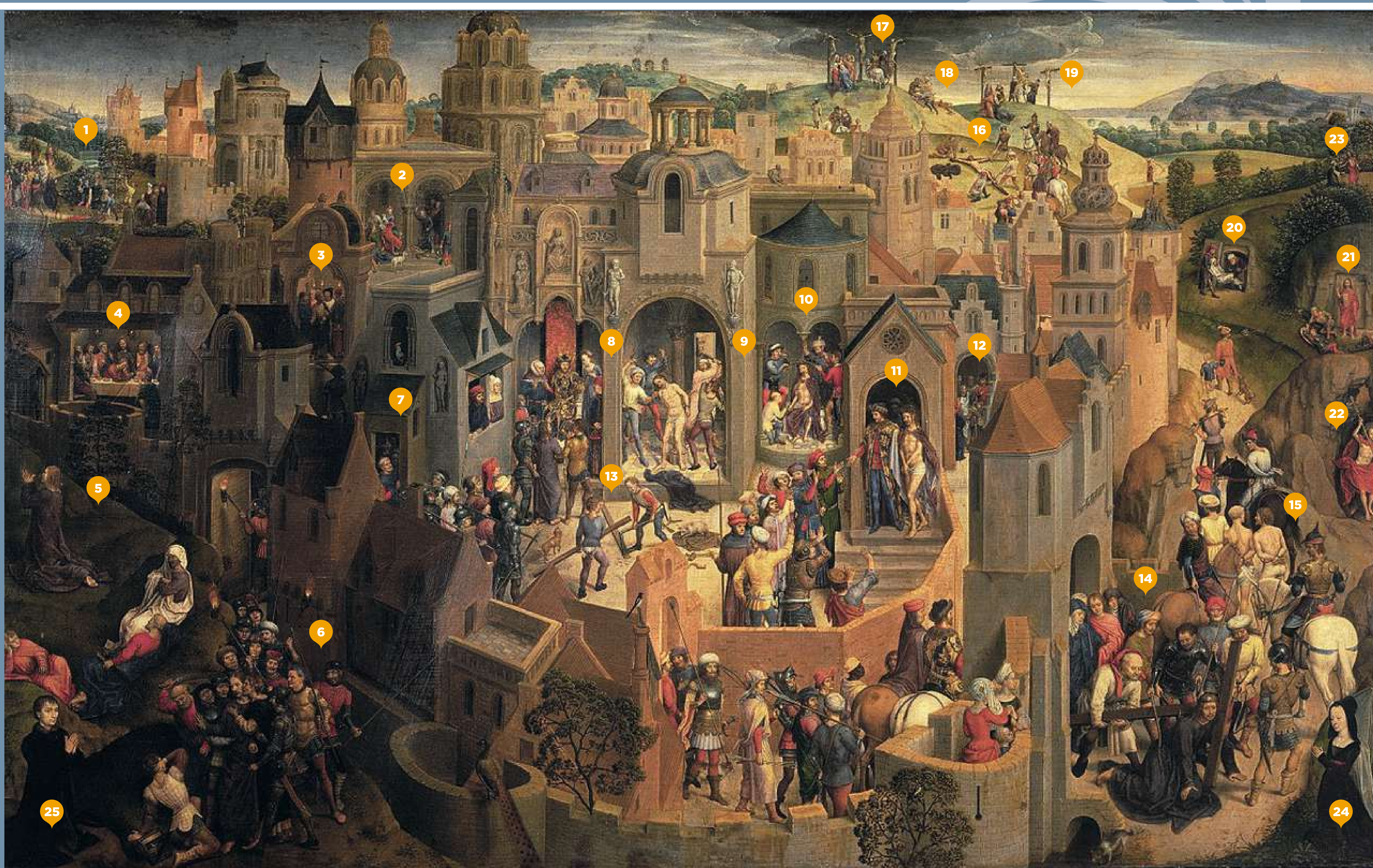
Scènes de la Passion du Christ • Hans Memling • 55 cm x 90 cm • 1470–1471 • Galerie Sabauda à Turin